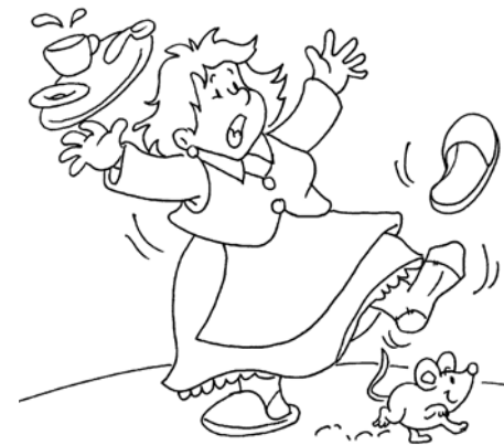
C. Reprendre ses esprits