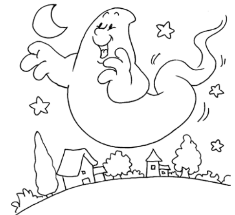
D. L'Esprit souffle où il veut

La réponse se trouve dans la Bible : Jean 3, 8 Bonne recherche !