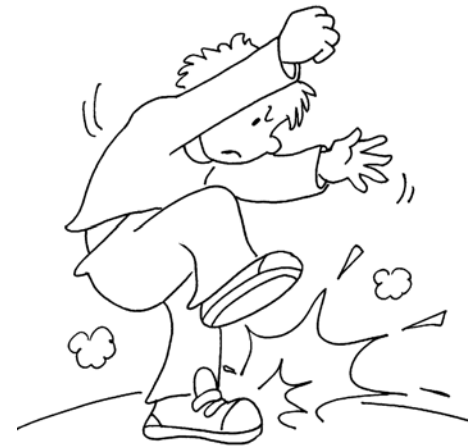
A. Être un enfant terrible

Quelle expression se trouve dans la Bible ?