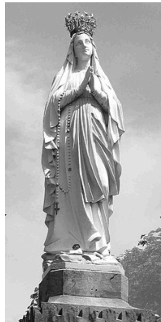
Notre-dame du Rosaire, Lourdes ( http://www.pictorialium.com )

HOLTZHEIM, ECKBOLSHEIM, WOLFISHEIM ET HANGENBIETEN