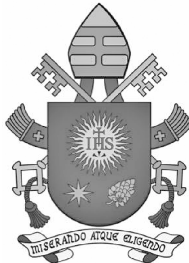
Le Blason du Pape François

Jésus vit un publicain et le regardant miséricordieusement en le choisissant, il lui dit: 'Suis moi!'